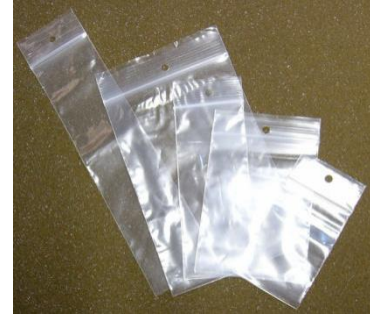
Sac refermable de type Ziploc

#ZIP22 #ZIP23 #ZIP25 #ZIP28 #ZIP33 #ZIP34 #ZIP46