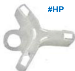
Plastics Flippers. Body. Monofilament et Protecteur pour trépied